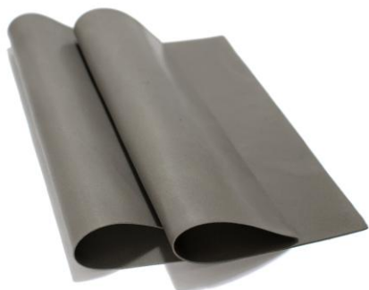
ЗИПСИЛ 601 РПМ-01 » ЛИСТ ШИРОКОПОЛОСНОГО ПОГЛОТИТЕЛЯ СВЧ-ЭНЕРГИИ ЛИСТОВОЙ ПОГЛОТИТЕЛЬ ЭЛЕКТРОМАГНИТНЫХ ВОЛН (ПЭВ) БЕЗ КЛЕЕВОЙ ОСНОВЫ