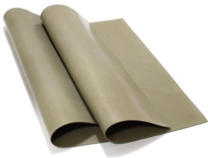
ЗИПСИЛ 101 РЭП-01 ⚡ ЛИСТ ЭЛЕКТРОПРОВОДЯЩЕГО ТЕРМОСТОЙКОГО СИЛИКОНА (ЭМС-ПРОКЛАДКА)