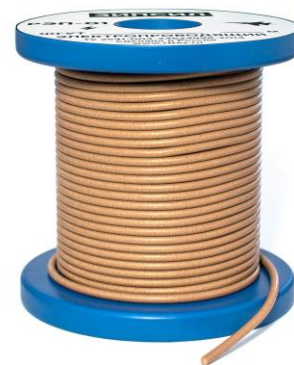
ЗИПСИЛ 201 РЭП-01 ⚡ ЭЛЕКТРОПРОВОДЯЩИЙ УПЛОТНИТЕЛЬНЫЙ ЖГУТ СИЛИКОНОВЫЙ О-ПРОФИЛЬ (ЭМС-УПЛОТНИТЕЛЬ)